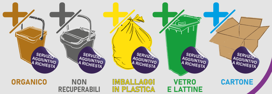
Servizi aggiuntivi a richiesta