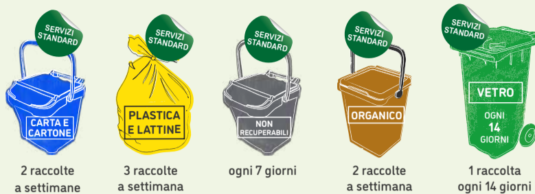
2 raccolte a settimane 3 raccolte a settimana ogni 7 giorni 2 raccolte a settimana 1 raccolta ogni 14 giorni