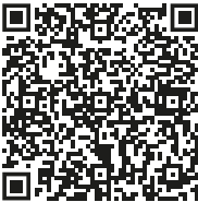
Guida per corretta gestione degli imballaggi leggeri