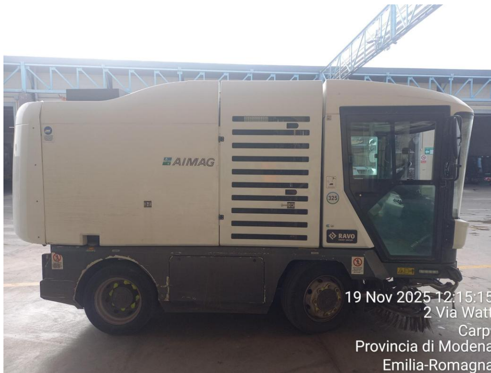
19 Nov 2025 12:15:15 2 Via Watt Carpi Provincia di Modena Emilia-Romagna