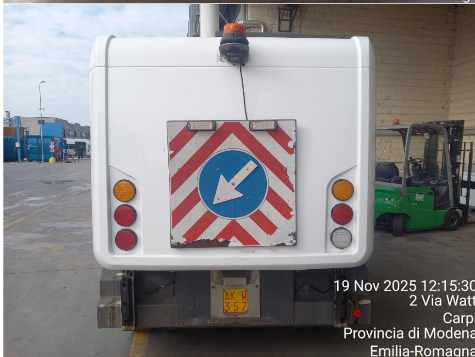
19 Nov 2025 12:15:30 2 Via Watt Carpi Provincia di Modena Emilia-Romagna